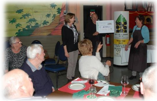
Eetcafé "De Dijketelg"

Havenstraat 1-2, 3421 BS Oudewater Telefoon: 0348 567 150